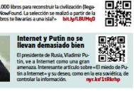
Manual para la Civilización. 3.000 libros para reconstruir la civilización (libro de texto) con los 3.000 libros para reconstruir la civilización. La selección de libros para la civilización preparada de: «¿Qué libros te llevarías a una isla?» bit.ly/1UJmUdU